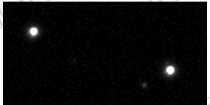
Un particolare ingrandito del bordo dello stesso campo ripreso CON il correttore RCC I. La correzione del coma operata dal correttore RCC I risulta ottima, con stelle da 10 micron (NW F4).

Tutte le foto e i testi contenuti e tradotti in questa scheda in lingua italiana sono di proprietà di Unitron Italia Srl. Il contenuto delle pagine non può essere riprodotto, pubblicato, copiato o trasmesso in nessun modo incluso quello elettronico su internet o sul web, senza il permesso scritto della Unitron Italia Srl.